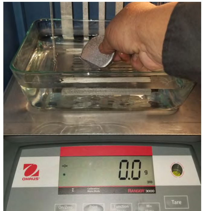
Fig. 4: Densitetsmåling er sikker, hurtig og nøjagtig.

Artiklen er bragt i "Palmer Solutions that Work". Den er gengivet med venlig tilladelse af "Palmer Manufacturing & Supply, Inc." Oversættelse: redaktionen