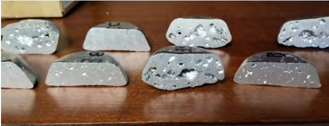
Fig. 3: Ingen grund til at skære prøven midt over.

GØR-IKKE: - Skær ikke RPT-prøven - Analysér ikke RPT-prøven ved visuel sammenligning med et standardfoto - Lad ikke en vilkårlig vurdering styre din proces